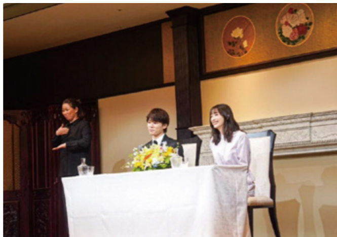
温かい雰囲気にもまれた結婚会見の様子。