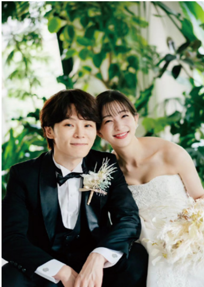
2023年9月に前撮り撮影をした。あらためて挙式も行う予定。